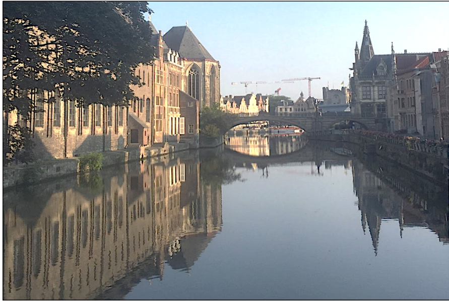
Tijdens workshop Gent 2020

een improvisatie. Dansdocente Lydia Mboku is van plan hier met de cursisten een mooie choreografie bij te bedenken.